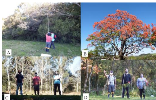
Figura 2 – Coleta de sementes de arbóreas nativas em formações florestais naturais, indicando uso prático do podão (A); imagem de Erythrina falcata Benth (B); bolsistas coletadores em expedições em 2020 e 2021 (C) e (D).